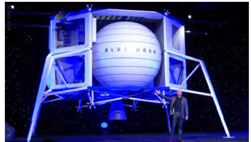
Der „Blue Moon“-Lander von Blue Origin. Das hier ist die kleinere von zwei Versionen

immer etwas anspruchsvollere Landemissionen folgen, bis dann etwa ab 2028 – so wie im ursprünglichen Gateway-Plan vorgesehen – mit Langzeitaufenthalten von jeweils vier Astronauten über mehrere Wochen oder Monate begonnen wird. Etwa ab diesem Zeitpunkt wird dann die Infrastruktur für eine permanente Mondstation entstehen. Dieser Plan beinhaltet alles, was Vizepräsident Pence gefordert hat: Eine beschleunigte Rückkehr von Menschen auf die Mondoberfläche, die spätere Errichtung einer lunaren Basis und das alles mit Hilfe einer Mischung aus den üblichen Aerospace-Giganten wie Boeing und Lockheed und Auftragnehmern aus der New Space-Szene. Mit der vorgezogenen Mondlandung ist ARTEMIS zunächst einmal ein nahezu reines US-Programm (sieht man von den Service-Modulen der Orion-Raumschiffe einmal ab, die von Airbus in Deutschland gebaut werden). Für den Zeitraum 2024 – 2028, in der jährlich je eine weitere bemannte Mondlandung stattfinden soll, ist das Programm dann auch für internationale Partner offen.