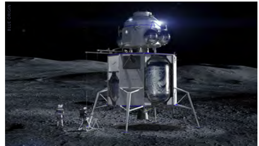
Die größere der beiden Blue Moon Lander-Varianten von Blue Origin hier mit einer (noch) hypothetischen Aufstiegsstufe

Dieses Angebot wurde von der Industrie sofort und in vollem Umfang angenommen. Blue Origin beispielsweise hat gleich drei Partnerschaftsprogramme mit insgesamt fünf NASA-Zentren vereinbart. Das Unternehmen wird mit dem Johnson Space Center und dem Goddard Spaceflight Center die Entwicklung eines Navigations- und Flugführungssystems für punktgenaue Mondlandungen durchführen. Das Johnson Space Center und das Glenn Research Center unterstützen Blue Origin mit den Brennstoffzellen für den Blue Moon Lander, der, geht es nach Blue Origin, sowohl im unbemannten Technologieprogramm als auch für bemannte Landungen eingesetzt werden soll. Für die Unterstützung bei der Entwicklung des Antriebs arbeitet Blue Origin mit dem Marshall Space Flight Center und dem Langley Research Center der NASA zusammen. Ähnlich verhält es sich mit SpaceX, die mit dem Kennedy Space Center zusammenarbeiten, um Interaktionsmodelle der Raketenabgase mit dem lunaren Regolith zu erstellen, damit die vertikale Landung großer Raketen auf dem Mond erleichtert wird. SpaceX arbeitet mit dem Glenn- und Marshall-Zentrum zusammen, um eine Treibstofftransfer-Technologie für ihr Starship zu entwickeln. Weitere Firmen, die Partnerschaften mit der NASA vereinbart haben, sind Aerojet Rocketdyne, Lockheed Martin und die Sierra Nevada Corporation.