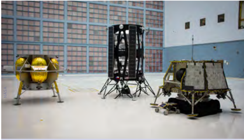
Modelle der Mond-Landehikel von Astrobotic, Orbit Beyond und Intuitive Machines