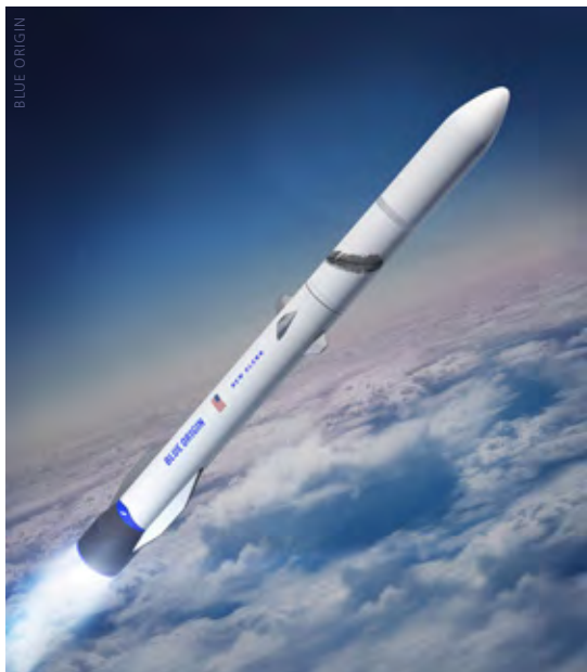
New Glenn-Trägerrakete von Blue Origin

Milliarden Dollar angesammelt. Die geplante „Plünderung“ dieses Fonds rief allerdings sofort den erbitterten Widerstand der Demokraten im Kongress hervor. Dennoch darf man nicht übersehen, dass die ARTEMIS-Mondlande-Initiative auch bei den Demokraten viele Befürworter hat. Das „Startgeld“ muss also woanders her kommen. Von woher genau war im September 2019 noch nicht bekannt. Die 1,6 Milliarden für das Jahr 2020 sind allerdings nicht mehr als eine Anzahlung, denn 2021 bis 2024 wird die NASA jährlich etwa vier bis